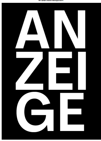
Ganzseitige Anzeige (203 x 277 mm) 664 Euro