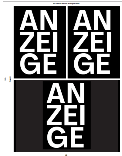
Halbseitige Anzeige (203 x 137 mm) 349 Euro